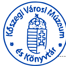
..... intézményvezető Kőszegi Városi Múzeum és Könyvtár

Jelen Adatvédelmi Szabályzat 2021. március 1. napján kihirdetésre és kifüggesztésre került a Kőszegi Városi Múzeum és Könyvtár székhelyén, továbbá a www.koszeg-konyvtar.hu és a www.kvmkl.hu honlapon.