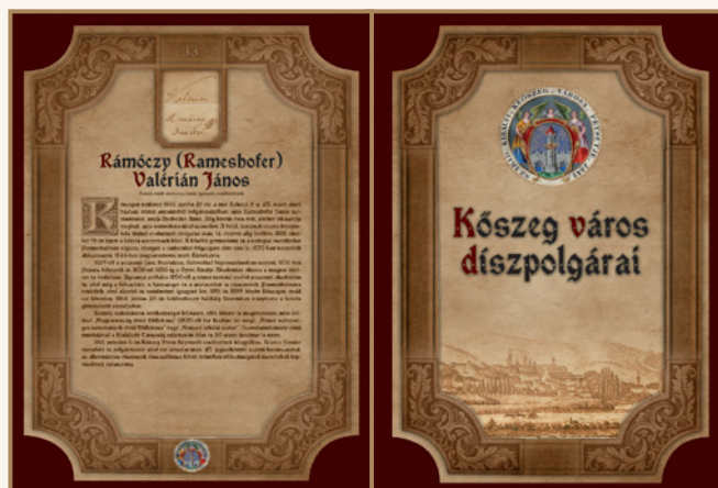
Az album egyik oldala

Kép: Rámóczy Valérián aláírása. Vas Megyei Levéltár Kőszegi Fióklevéltára. A Bencés Rend Kőszegi Gimnáziumának iratai. Tantestületi jegyzőkönyvek, 1854. ápr. 1.