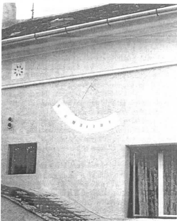
A Hunyadi utca 7. számú ház napórája

Napóra van a délkeleti udvari falán, 3,5 m magasan. Vertikális. Árnyékvetője pólusra mutat. A számlap vakolatra festett. Negyedkör alakú sáv 0,8 m-es sugárral. Óraszám-mozgása: VI-XII. I, változó közül. A napóra 1906-1910 között az épület felépítését követően készült. Eredeti állapotú, a későbbi felújítások során a helyét kihagyták. 2