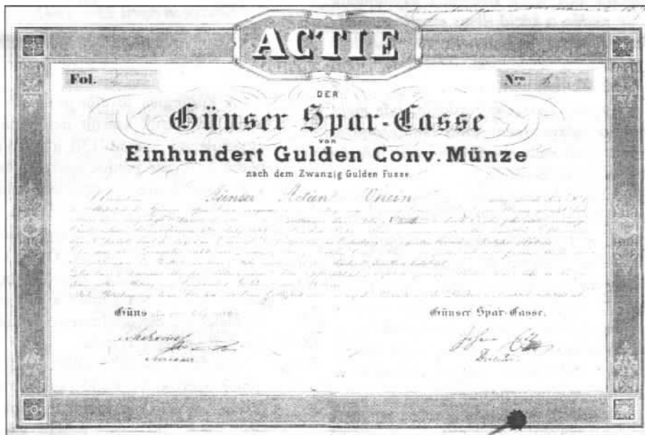
A Kőszegi Takarékpénztár első részvénye

hatalmat – mint mondják – szinte zsidó kezek monopolizálják, 's azért – fennmaradása remélhető is – nem fogja oly nagy mértékben árasztani jótékony hatását. Nem vagyunk elleni az emancipationak; de fáj tudnunk, hogy vannak emberek, kiknél árucikk az igazság és becsület. Ha e' hatalmas nyavalán segítené az emancipatio, az emberiség egyik