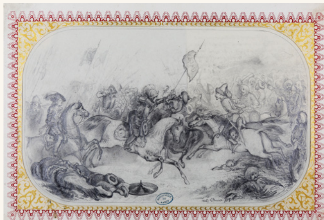
Lotaringiai Károly herceg szentgotthárdi hőstette (Nancy, Városi Könyvtár)