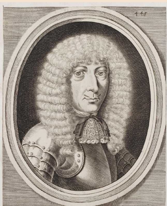
G CONTE DE COLIGNY LVOGOTENENTE GENERALE DEGLIESERCITI DE RE CHRISTIANISSIMO E COMMANDANTE GENERALE DELLE TRUPPE FRANCESI IN VNGHERIA

Jean de Coligny-Saligny gróf portréja az arolseni hercegi könyvtár 17. századi metszetgyűjteményében