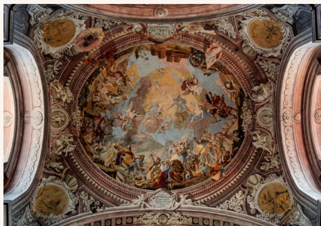
A szentgotthárdi csata allegorikus ábrázolása (Nagyboldogasszony templom Szentgotthárd, Dorfmeister István 1784)

Zrínyi személye a korabeli médiumok által ismertté vált, eredeti gondolkodású, a magyar rendek által támogatható személynek tűnt a francia diplomácia számára egészen haláláig.